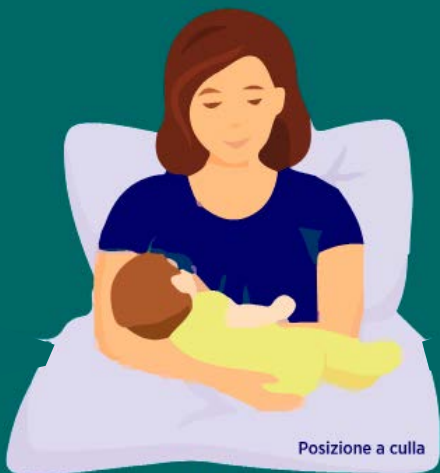
Posizione a culla

Il bambino è tenuto con il braccio opposto al seno utilizzato e la mano della mamma sorregge la nuca.