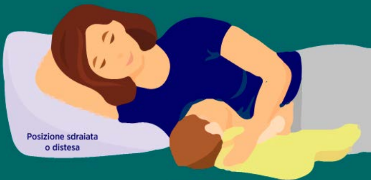
Posizione sdraiata o distesa

Il bambino è sottobraccio alla mamma con i piedini che puntano all'indietro.