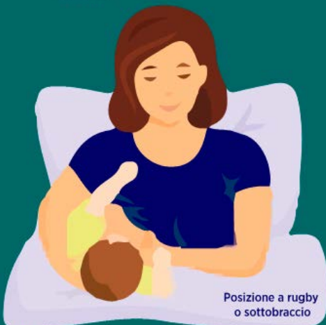
Posizione a rugby o sottobraccio

Il bambino è sottobraccio alla mamma con i piedini che puntano all'indietro.